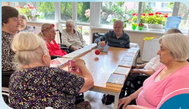
Leto sme si krátili športovými hrami.