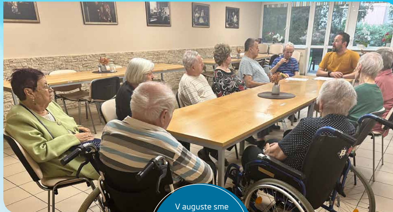
V auguste sme si povedali viac o ľudských právach a aj viac o tom, kto je kľúčový pracovník a dôverník.