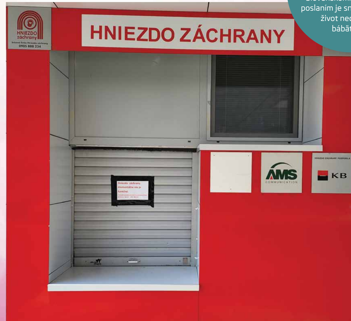
Mapa Hniezda záchran

Verejné inkubátory, ktoré nesú pomenovanie Hniezda záchran sa nachádzajú naprieč celým Slovenskom. Ich hlavným poslaním je snaha zachrániť život nechceným bábätkám.